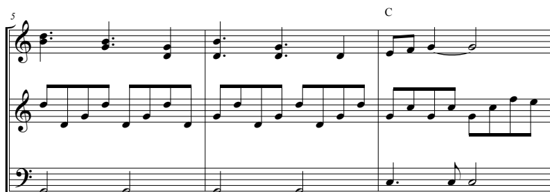
Abb. 2: Mood I